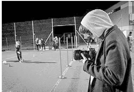
Drehtage im September 2019 (l.) und Februar 2020 (r.) mit den Junior*innen.

Im Frühjahr 2019 schreiben wir die ersten Kapitel zu den Gründungsjahren, den Kriegsjahren und der erfolgreichen Nachkriegszeit. Es erweist sich dabei als Glücksfall, dass ein Historiker im Komitee ist, der das Archivmaterial erstmals gründlich durchstöbert und auf dieser Basis die Geschichte des FC Langnau a.A. von 1920 bis 1980 rekonstruiert und spannend erzählt. Wir ergänzen die historischen Fakten mit aus der Erinnerung abgerufenen Darstellungen der letzten 40 Jahre, die einige von uns selbst stark geprägt haben. So entstehen auch spannende Kapitel zur Sihlmatte mit ihren drei Clubhaus-Bauten, zur stets prekären Finanzlage des Vereins und zur Erfolgsgeschichte des Schülerturniers seit 1971.