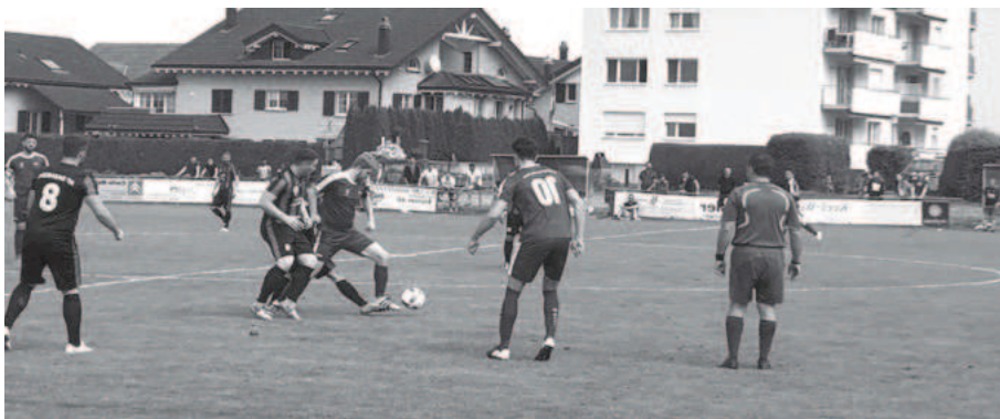
SC Siebnen – FCL 3 : 2

Nach den guten Resultaten in den sieben Vorbereitungsspielen (u.a. zwei Unentschieden gegen Teams aus der 3.Liga) war die Hoffnung auf eine erfolgreiche Rückrunde gross. Allen Beteiligten war bewusst, dass das erste Spiel der Rückrunde gegen den FC Red Star bereits wegweisenden Charakter für die weitere Rückrunde haben würde. Ein ausgeglichenes Spiel, das vor allem vom Kampf lebte, wurde leider durch einen völlig missratenen Pass unseres Goalies in die Füße des Gegners, so dass dieser nur noch in das leere Tor einzuschieben brauchte, sehr unglücklich entschieden. Dadurch wurde die erste Möglichkeit näher an die Tabellenspitze heranzukommen nicht genutzt. Die Reaktion des Teams kam dann im zweiten Spiel gegen den FC Mezopotamya 1. 2 : 3 für den FCL hiess es am Schluss dieser Partie.