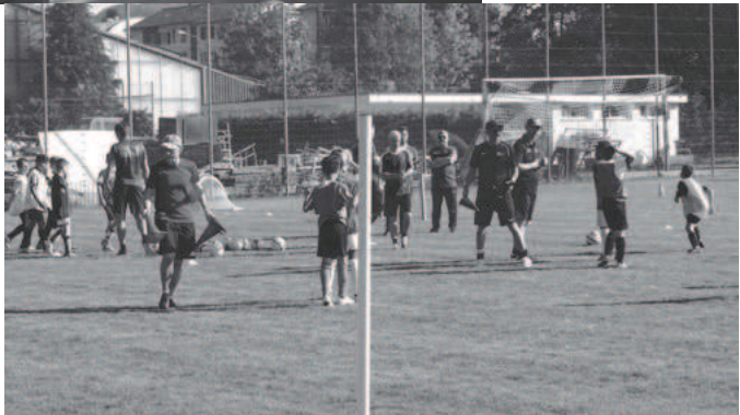
Bilder: Hochbetrieb auf der Sihmatte anlässlich des Mustertrainings mit unseren Junioren